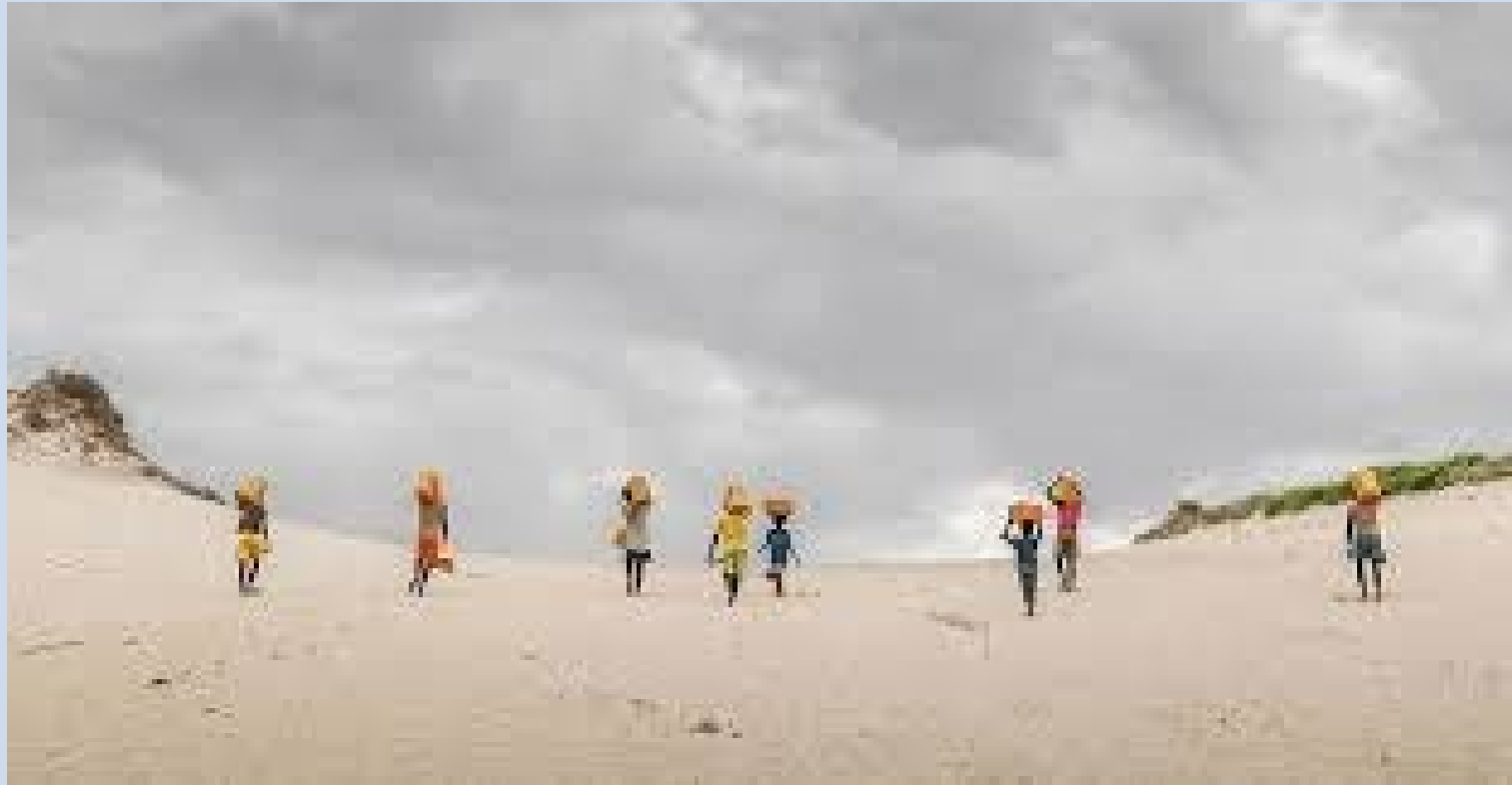
UNICEF: Dürre und Hunger in Madagaskar